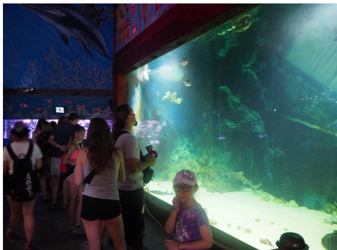
V Mořském světě v Praze je stálá expozice mořských, ale i sladkovodních ryb a jiných živočichů o celkovém počtu 360 druhů. Největší nádrž, kterou obývají žraloci, má objem 100 000 litrů mořské vody.

V zámku se uskutečnily Dny evropského dědictví , v rámci speciálních prohlídek byla zpřístupněna ve večerních hodinách borská Loreta. Tu si mohou návštěvníci zámku prohlédnout již od srpna, kdy správa zámku zařadila Loretu do prohlídkového okruhu.