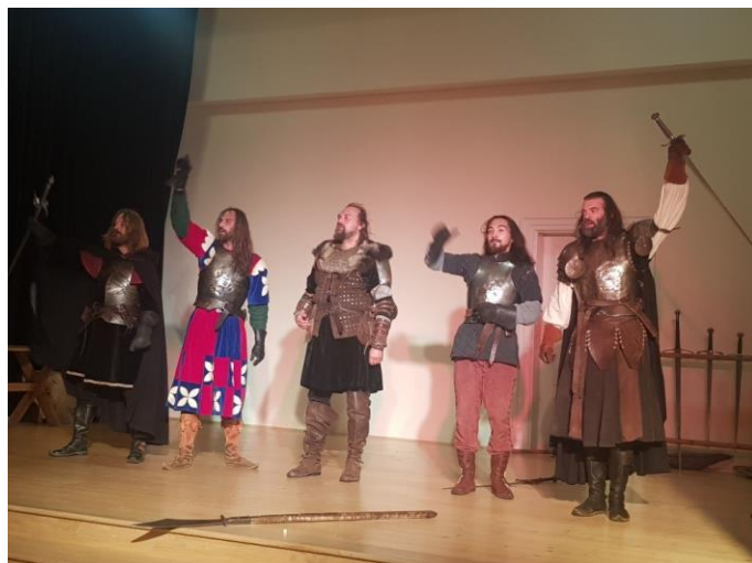
Během prohlídek zámku se představila skupina historického šermu Equites.