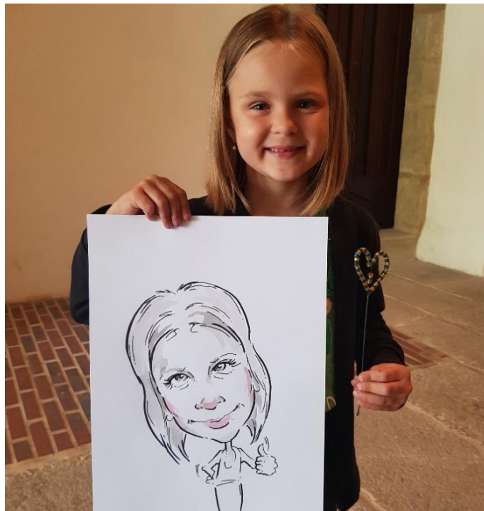
Návštěvníci zámku dostali na památku svou karikaturu.