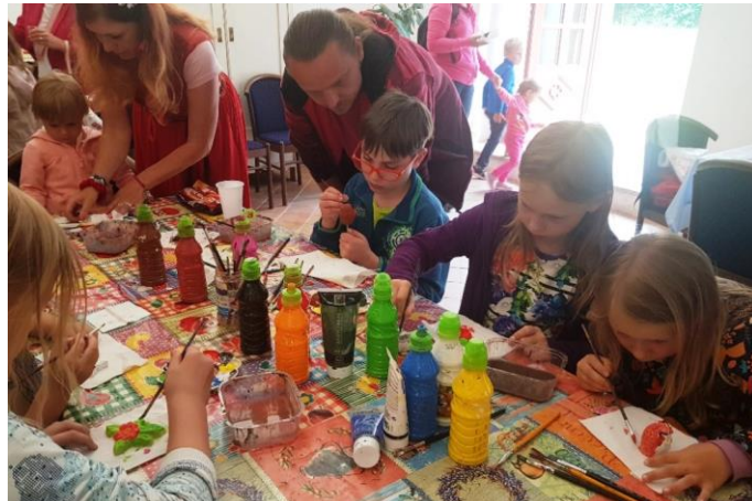
Tvůrčí dílny pro děti v Hodovní síni zámku

Zámecké historické slavnosti byly zrušeny již v květnu, místo nich se v zámku uskutečnily oživené prohlídky se šermířskými, tanečními a hudebními vstupy. Kromě toho probíhaly po celý den výtvarné dílny pro děti v Hodovní síni zámku a také malování karikatur.