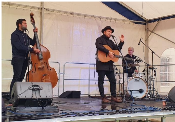
Skupina Voxel a spol. byla hlavním hostem slavností