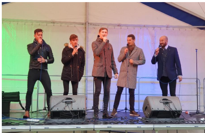
Vokální kvinteto Hlasoplet