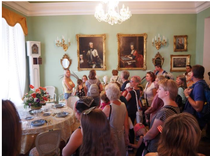
Prohlídka zámku Karlova Koruna v Chlumci nad Cidlinou, který patří šlechtickému rodu Kinských

Prázdninový zájezd pro děti a rodiče proběhl dle plánu – uskutečnila se prohlídka zámku Karlova Koruna, báječně strávené sobotní odpoledne ve Fajn parku v Chlumci nad Cidlinou se stovkou atrakcí pro všechny věkové kategorie, prohlídka centra Botanicus Ostrá, kde si děti mohly vyrábět papír, svíčky, mýdla a mnoho jiného, k vidění byly bylinkové a květinové zahrady a na konec výprava zavítala do Mořského světa v Praze. Přenocování bylo zajištěno v Domově mládeže v Poděbradech, přímo u lázeňského centra. Účastníkům přálo velmi krásné počasí, a tak byl výlet velmi povedený.