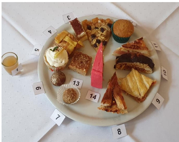
Soutěžní výrobky, tak jak je dostala k hodnocení porota